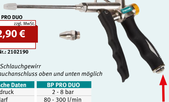
BP PRO DUO